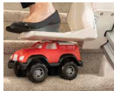
傳感器保證安全性