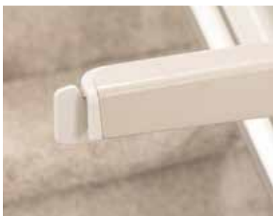
符合人 工程 的扶手控制。