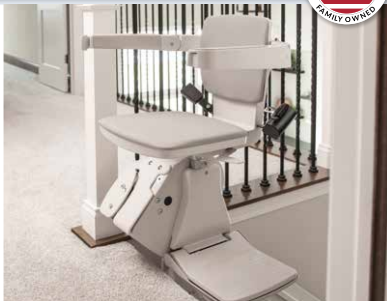
偏置旋轉座椅，上下方便。