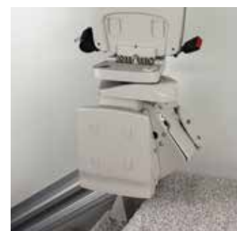
電動折疊踏板座椅升/降時自動上/下收放。可選的扶手開關操控。