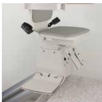
電動旋轉座椅方便下椅。 扶手開關操控或無線收/放。