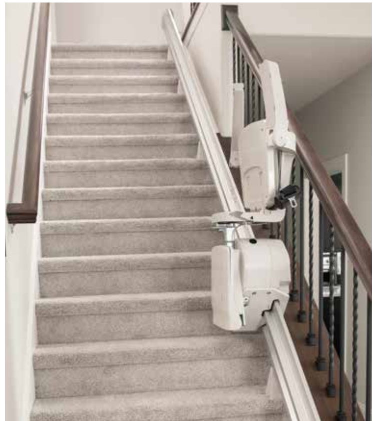
結構纖巧、折疊式設計， 為樓梯保留大量開放空間。