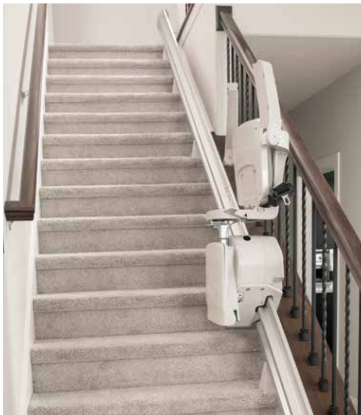
结构紧凑、折叠式设计， 为楼梯保留大量开放空间。