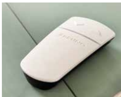
两个无线遥控收/放装置