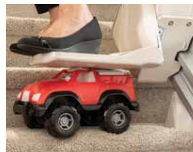
传感器保证安全性