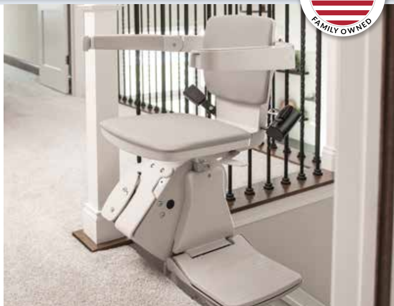
偏置旋转座椅，上下方便。