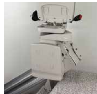
电动折叠踏板座椅升/降时自动上/下收放。可选的扶手开关操控。