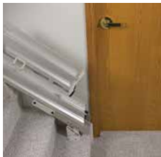
功率或手动折叠导轨为狭窄的走廊或时门口是在楼梯的底部。手动操作或推送按钮自动。